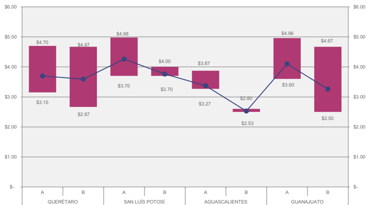
PRECIOS DE RENTA USD/M2 POR TIPO DE NAVE

Los valores promedio más altos los encontramos en bodegas tipo A en San Luis Potosí ($4.26USD/M2) y los más bajos en bodegas tipo B en Aguascalientes ($2.60USD/M2).